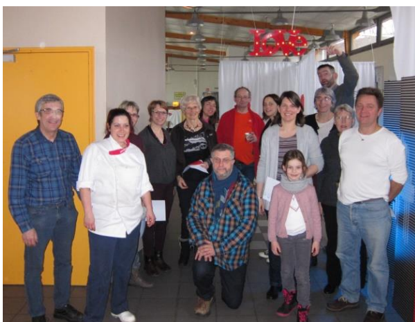
L'équipe de bénévoles de Pontarlier prête à vous recevoir pour la St Valentin autrement

Alors ne manquez pas cette belle proposition, ainsi cette année vous aurez 20/20 pour la St Valentin !