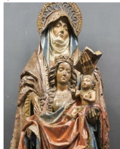
Sainte Anne, Sainte Marie et l'enfant Jésus