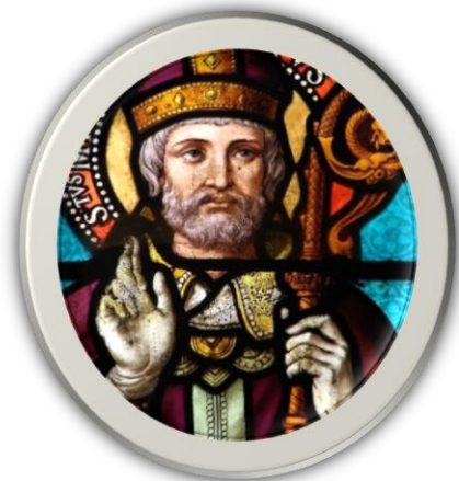
Le Chemin de l'Évêque de Tours