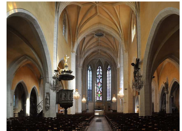
L'intérieur de la basilique