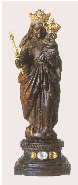
Notre-Dame de Gray

Concert d'orgue à 17h00 en l'honneur de Marie.