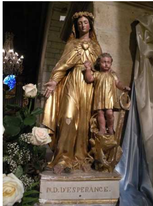
Notre Dame d'Espérance

Surtout fréquenté par les promeneurs, qui y trouvent un lieu de recueillement d'où ils peuvent observer un panorama sur Pontarlier, le Larmont et la plaine d'Arlier. L'accès de la chapelle est libre et gratuit.