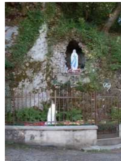
Reconstitution de la grotte de Lourdes