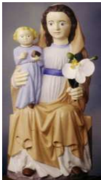
Notre Dame de Bon Secours

On y accède à pied par la rue du Théâtre ou la rue du Pont.