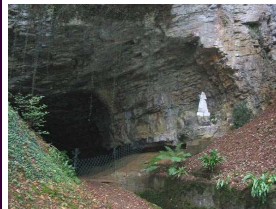
La grotte de Notre-Dame de Solborde