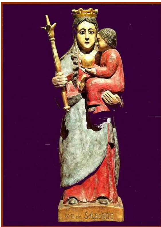
Vierge à l'enfant dite