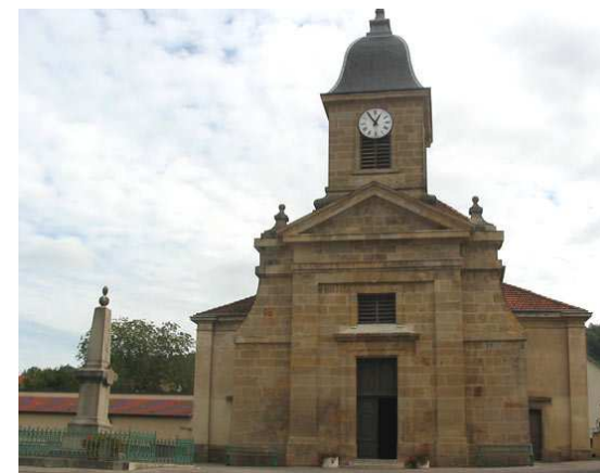
Echenoz: Eglise du XII ème siècle