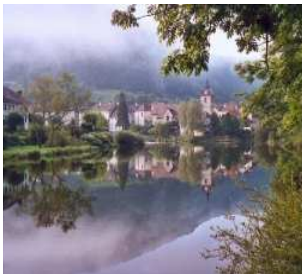
Depuis le belvédère

Un pèlerinage et une messe en plein air ont lieu le jour de l'Assomption. Ce lieu est aussi un lieu de promenade en famille. On domine la ville et l'on découvre depuis le site les vallées du Doubs et du Dessoubre, qui se rejoignent au pied de l'église de la ville.