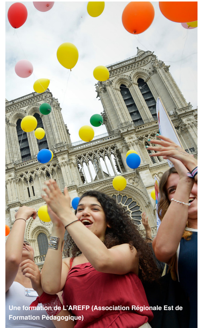
Une formation de L'AREFP (Association Régionale Est de Formation Pédagogique)