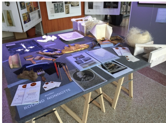
faux marbre, faux bois, feuille d'or, moulure...