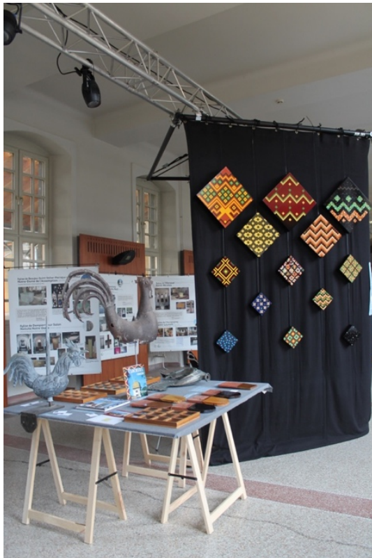
Les tuiles vernissées et le coq