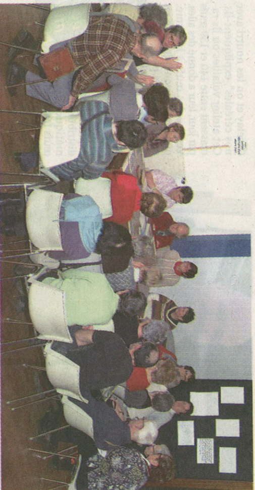
Un groupe au travail.

"Déballez, débattiez, découvrez", tel était le thème de la journée "3D", organisée pour le doyenné de Gray, samedi en salle des Congrès.