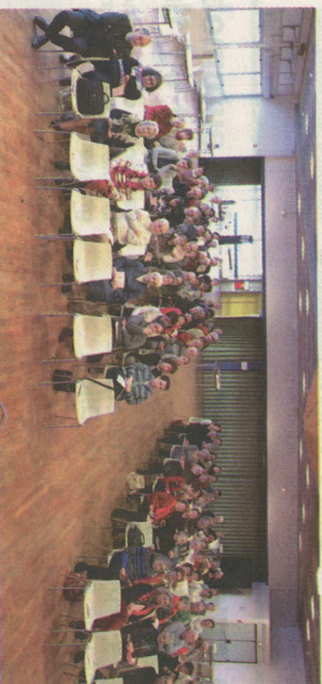
150 participants ont écouté l'archevêque, samedi.