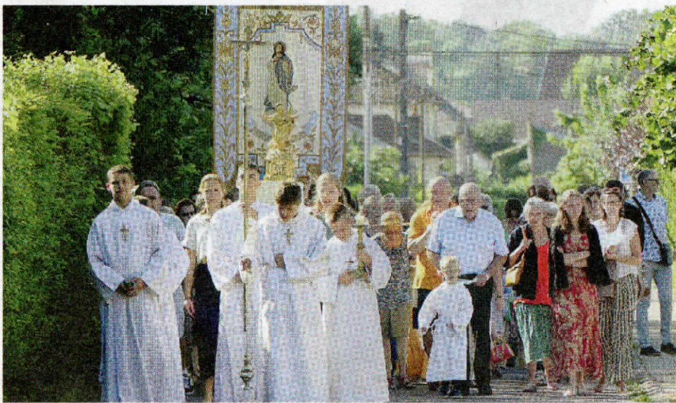
Le départ de la procession, contre-allée des Capucins.

Sauvée de la disparition, et de ce fait de l'oubli, la délicate pièce d'étoffe n'en avait pas moins souffert des ravages du temps. D'où le besoin de la restaurer, ce qui a pu être réalisé grâce au financement de l'Association pour la sauvegarde, la restauration et la mise en valeur du patrimoine religieux de Gray, avec le soutien de la Ville. Et surtout, grâce au talent des carmélites de Lisieux, dont le long et fastidieux travail a encore été rendu plus compliqué par l'attaque de la mérule dans leurs ateliers. Ainsi a pu être préservée, avant d'être