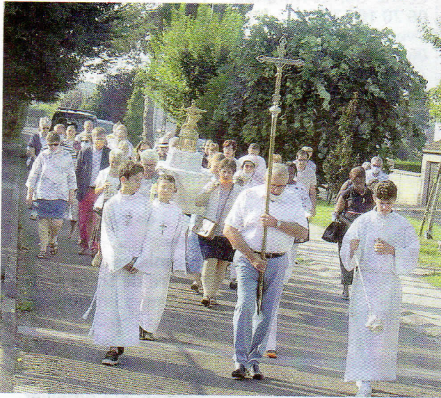
Les fidèles, sur le chemin.

À l'occasion de l'Assomption, une procession de fidèles s'est rendue de la statue de la sainte patronne de la ville jusqu'à la basilique.