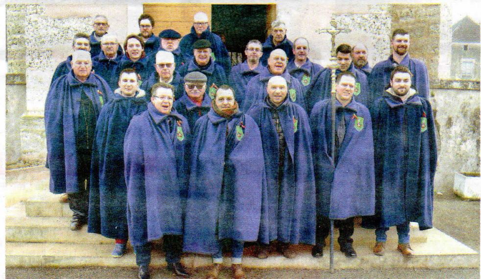
Les membres de la confrérie Saint Sébastien.