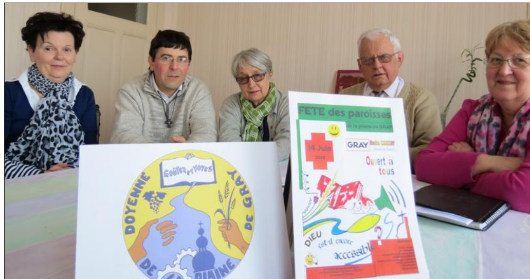
■ Rendez-vous est pris pour une journée sur le thème de « Dieu est-il encore accessible ? »

Un geste d'ouverture, aux accents festifs. L'équipe du doyenné de la plaine de Gray, qui planche sur la communication du premier événement du genre dans le Graylois, vise avant tout le rassemblement populaire. L'entité, qui lie, par-delà les six paroisses de Gray, Pesmes, des Monts de Gy, d'Arc-Autrey-Champlitte, de Dampierre-sur-Salon et Fresne-Vellexon, pas moins de 117 communes, est en effet à un tournant, avec une diminution à deux curés en septembre prochain (lire par ailleurs).