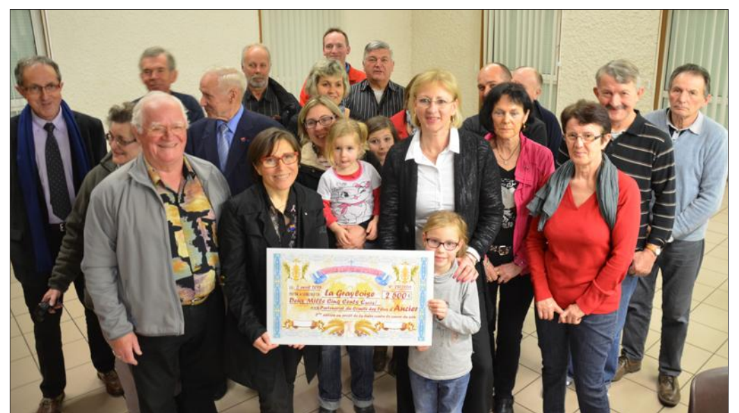
■ Le Comité des Fêtes a retiré un bénéfice de 2 500 euros pour la Grayloise

Cette somme va s'ajouter au bilan financier de la Grayloise qui sera reversé en intégralité à la Ligue contre le cancer de Haute-Saône afin de financer des actions locales au profit des malades. Un montant qui s'annonce record et dont le