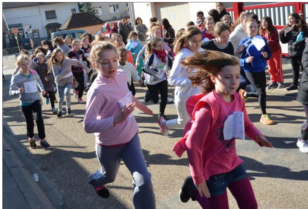
■ Les CM2 au départ.

La commune de Rigny a financé les médailles remises aux trois premiers de chaque catégorie tandis que l'Usep a