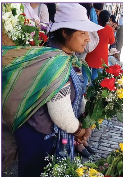
Chargée de fleurs au marché des femmes

Je ne rentre pas indemne de cette aventure, en ayant été confronté aux réalités d'un pays en pleine mutation. Le Pérou est touché par l'exode rural, car de nombreux jeunes fuient la rudesse des travaux agricoles et veulent poursuivre leurs rêves en migrant vers les grandes villes. Poursuivre oui, avec un autre regard sans doute, car le vrai combat, c'est la défense et le respect de la vie ! Continuer à oeuvrer dans le sens des objectifs du CCFD-TS avec les thématiques de souveraineté alimentaire, de justice économique et de lutte contre le patriarcat.