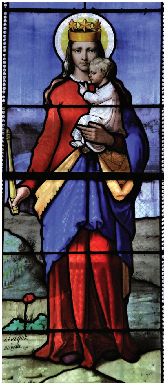
Vitrail de la basilique de Gray.

De nombreuses processions sont organisées dans le doyenné.