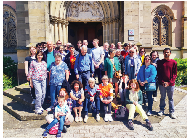
Les pèlerins devant la basilique de Mattaincourt.

Dans le même temps les habitants de Gray et de tout le secteur s'appêtent à assister prochainement à la mise en eau de la très célèbre fontaine St Pierre-Fourier. Les travaux de rénovation ont débuté en automne 2023 financés par la commune de Gray, avec une participation de la Fondation du Patrimoine.