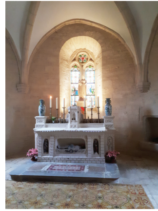
Le chœur de la chapelle, entièrement restauré.