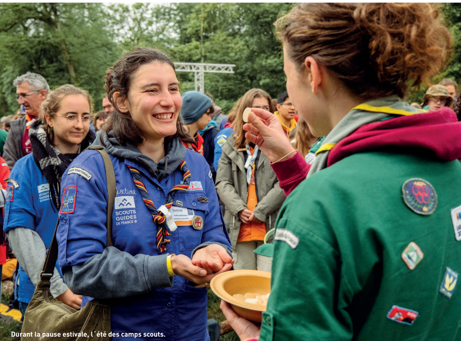
Durant la pause estivale, l'été des camps scouts.