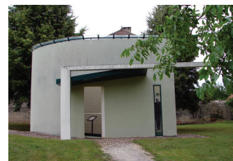
Le mémorial Rimet à Theuley.

En 1998, le village de Theuley a édifié en son honneur, un mémorial situé près de l'église.