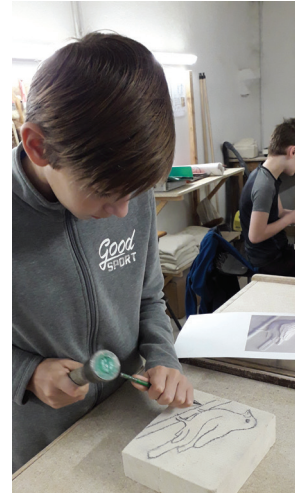
Des élèves attentifs aux gestes du sculpteur.

Les dates des prochains stages seront publiées à l'Office du tourisme des Monts-de-Gy, dans la presse et sur le site de l'association www.patrimoine-montsdegy.fr