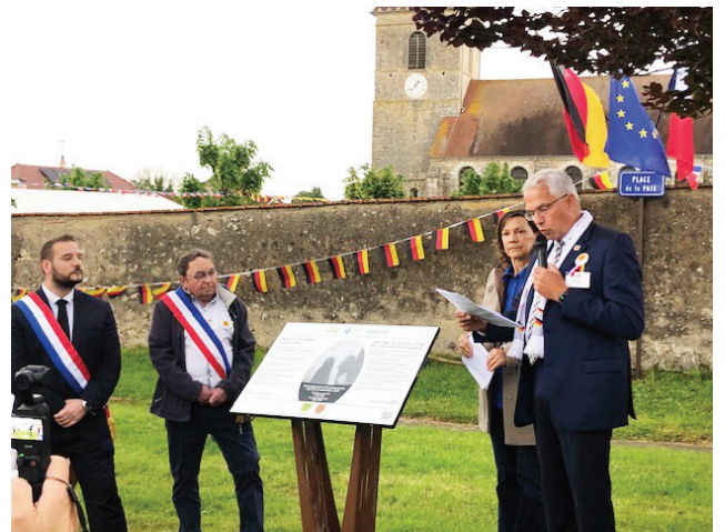
Place dédiée à la mémoire.

Ils y ont cru, et la présence de nos amis allemands, en est la preuve.