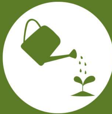
SOUTIEN FINANCIER AU CHÂTELARD OU AUX ŒUVRES JÉSUITES https://www.chatelard-sj.org/soutenir-le-chatelard-et-la-compagnie-de-jesus/