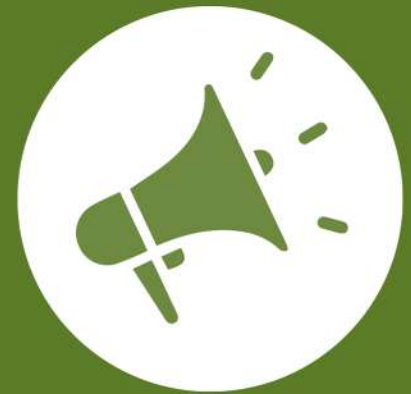
COMMUNICATION SUIVEZ-NOUS SUR LES RÉSEAUX ET PAR NEWSLETTER https://www.chatelard-sj.org/