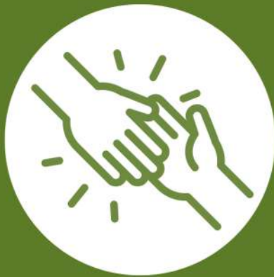
BÉNÉVOLAT BIENVENUE! Pour prendre contact rdv sur: https://forms.gle/4Sm9ENT43nJJbbb77