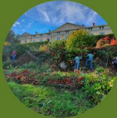
LE CHÂTELARD 41 ROUTE DU BRUISSIN 69340 FRANCHEVILLE accueil@chatelard-sj.org 04 72 16 22 33