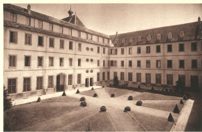
Ancien Grand Séminaire, vers 1930