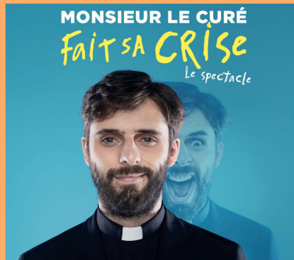
Monsieur le curé fait sa crise