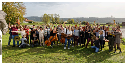
Orchestre Universitaire Besançon Franche-Comté