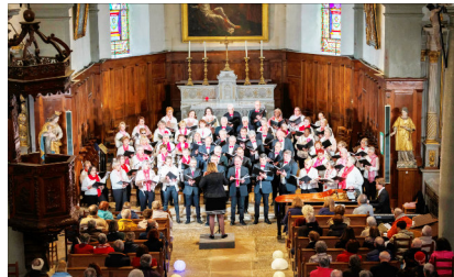
Alter Chor

➔ Chapelle - 18 € (16 € en prévente) Prévente : www.alterchor.fr