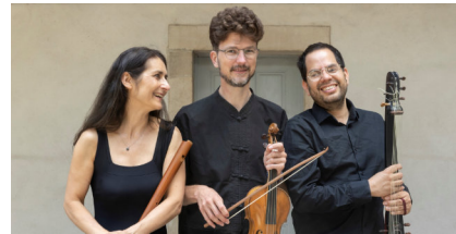
Les Alizés © Yves Petit