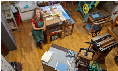
Elvi la Relieuse