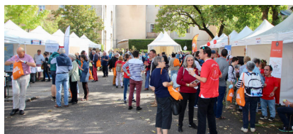
Congrès Mission Besançon 2021