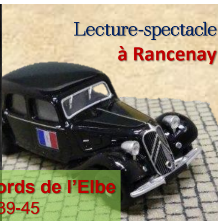
Lecture-spectacle à Rancenay

parcours-spectacle 25, 27 juillet 21h 22, 23 août 20h30