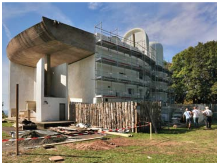
Déplacement de l'échafaudage côté est, chœur extérieur