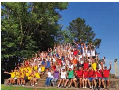
Pèlerinage des jeunes cyclistes

Atelier pictural : quelques adultes en week-end du 1 er et 2 juillet, ont découvert ou approfondi les dessins de Le Corbusier et crée leurs propres peintures.