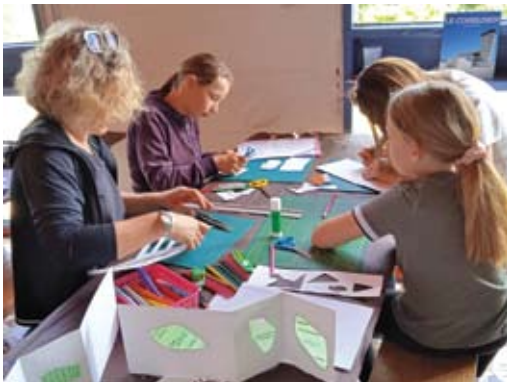
Atelier pictural des enfants