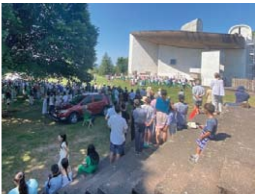
Pèlerinage des gens du voyage