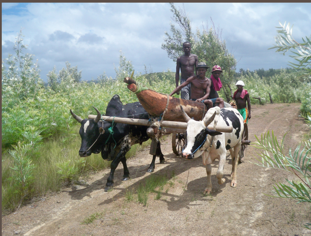
IMAGE TIRÉE DU FILM « COUPS DE HACHE POUR UNE PIROGUE » © GILDE R, 2022

Besançon accueille le réalisateur malgache GILDE RAZAFITSIHADINOINA, de Tamatave, du 3 au 8 novembre 2022.