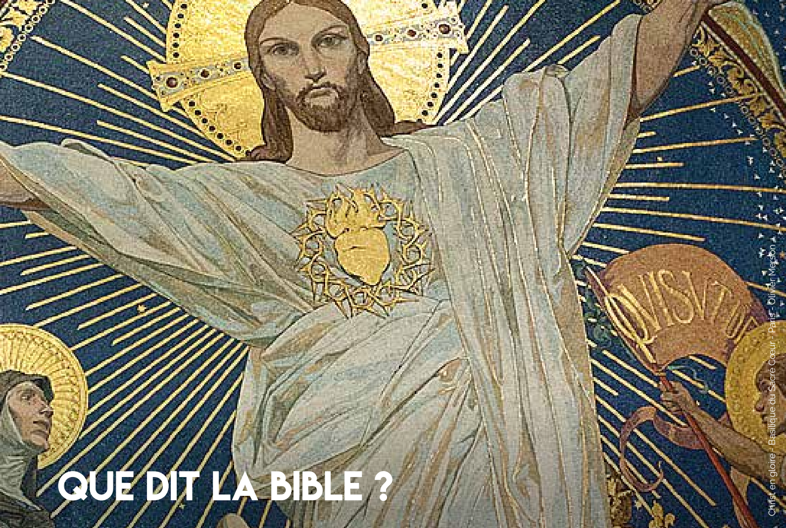
Christi en gloire - Basilique du Sacré Cœur - Paris - Olivier Metzson