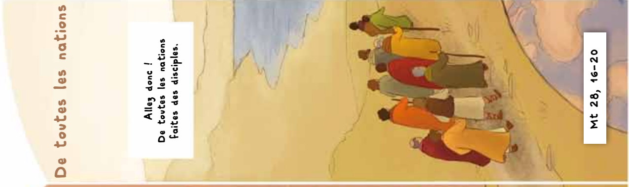
De toutes les nations

Allez donc ! De toutes les nations faites des disciples.