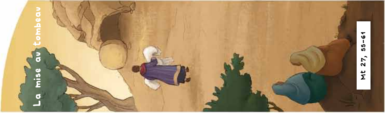
La mise au tombeau