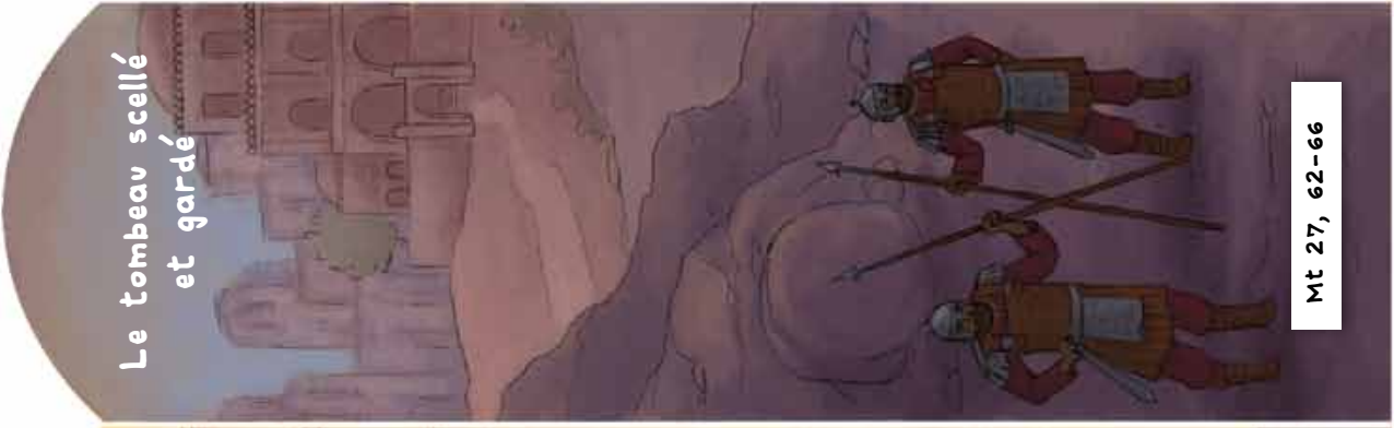
Le tombeau scellé et gardé