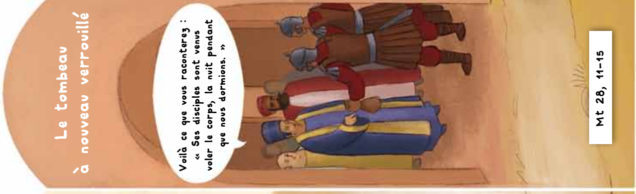
Le tombeau à nouveau verrouillé

Voilà ce que vous raconterez : « Ses disciples sont venus veler le corps, la nuit pendant que nous dormions. »